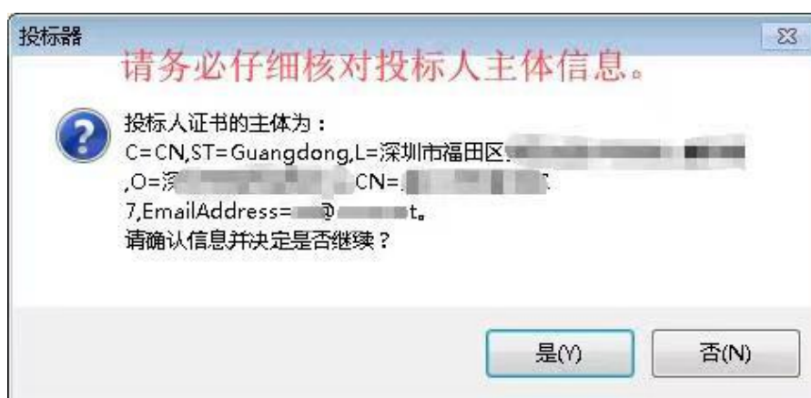
(图 1: 标书加密)