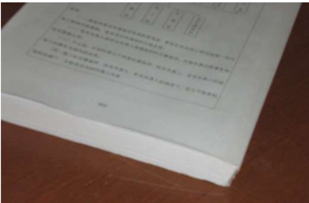
(注：上图为错误的封底格式，错误原因：封底面含有编制内容)