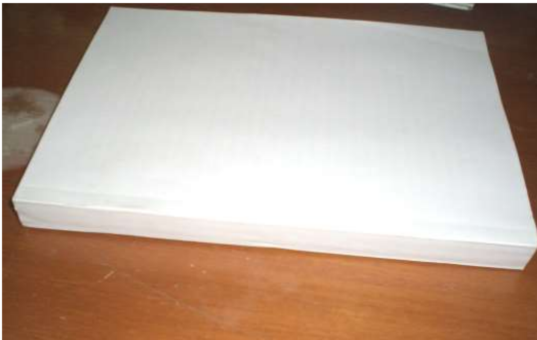
(注：上图为正确的封底格式)